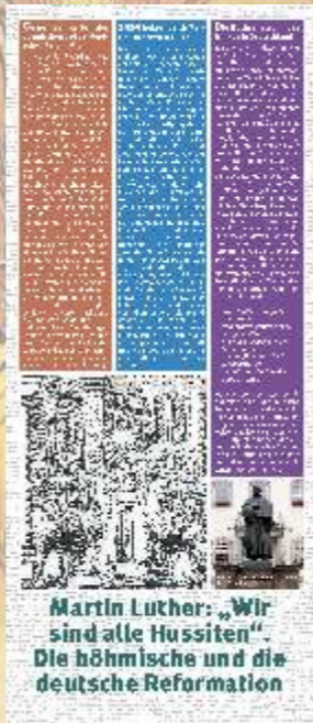
Martin Luthers: „Wir sind alle Hussiten!“ Die böhmische und die deutsche Reformation

sowie an den Sonntagen 08. März 15. März und 22. März von 11.00 bis 14.00 Uhr