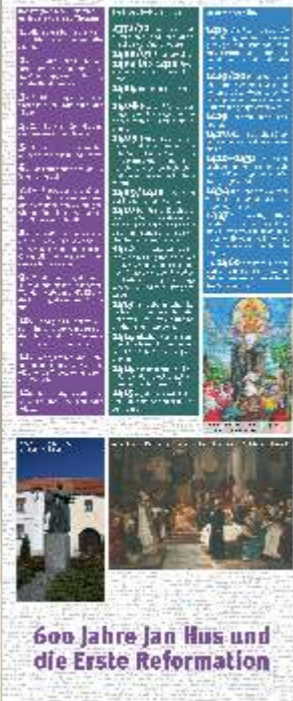
600 Jahre Jan Hus und die Erste Reformation

In unserer Ausstellung zeigen wir Ihnen auf 18 Text- und Bildtafeln das Leben und Wirken von Jan Hus, sowie einen Film über den Reformator