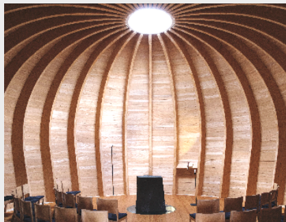
Das Bild zeigt die Kapelle im Feld in Bad Schwalbach